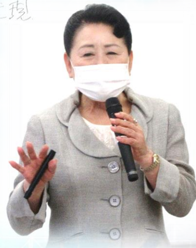
トータルマナー株式会社 代表取締役 関西作法会 会長