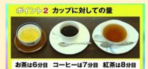
ポイント2 カップに対しての量

茶菓のマナーレッスン PART2 http://www.manner.co.jp/seminar/seminar-17.html