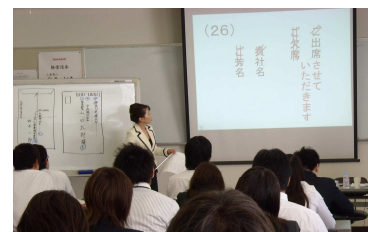
ビジネス文書研修