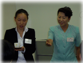
お茶の出し方研修

各部署に対応し、現場を意識した即戦力ある人材を育てるための研修をご用意しております。