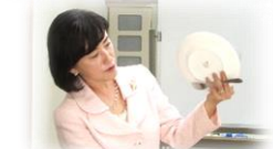
お皿とフォークの持ち方

パーティーは食べる事がメインではなく、交流することが一番の目的です。特に立食パーティーでは決まった席がなく、多くの方とお話するためには、飲み物と食べ物を持って移動しなければなりません。その際のお皿とグラスの持ち方を実際に行いました。全員で立ち上がり、「品格のある姿勢」「グラス・お皿・フォークの持ち方」「グラスとお皿の持ち方」などを実践しました。